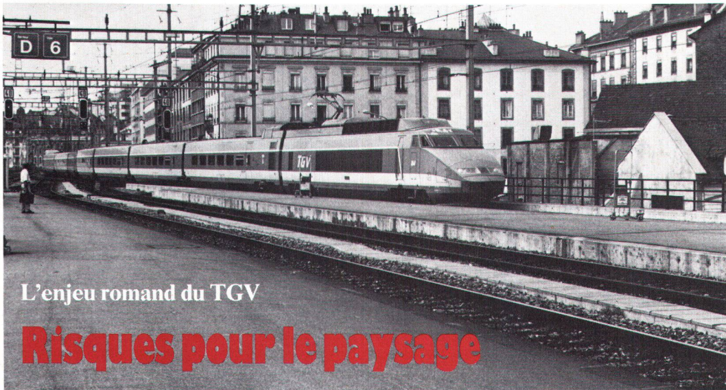
L'enjeu romand du TGV