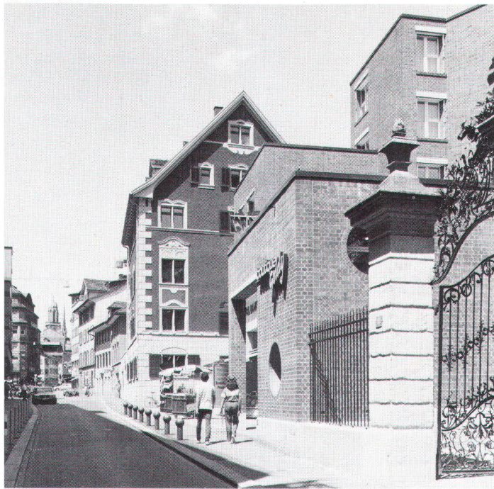
Neue Architektur muss immer auch mit ihrer traditionellen Umgebung zusammenspielen.

Meiner Ansicht nach ist die Grundlage für das Entstehen von Architektur eine baukünstlerische Absicht des projektierenden Architekten. Kaum gesagt, frage ich mich, weshalb wir Ställe, Scheunen, Häuser im traditionellen Dorf beidseits der Alpen als schön empfinden. Sicher hatte kein Architekt seine Hand im Spiel. Die Ställe und Häuser im traditionellen Dorf wurden von Menschen gebaut, die über Generationen lernten, mit den ortsüblichen oder den am Ort vorhandenen Baumaterialien auf vernünftige Art umzugehen. Die Materialien waren beschränkt. Es gab wenige, ebenfalls über Generationen entwickelte Werkzeuge. Menschliche Muskelkraft wurde verstärkt durch die Kraft der Esel, Ochsen und Pferde. Der Umgang der Menschen mit der Natur war behutsam – nicht weil sie feinfühliger Leute waren, als wir es heute sind, sondern weil sie gar keine andere Wahl hatten. Es wurde nicht so viel wie heute, aber recht gut gebaut. Architektur, also Bauten basierend auf einer baukünstlerischen Absicht eines Architekten gab es wenige. Die Kirche, Nobilität, später auch die bürgerliche Öffentlichkeit waren dafür die Auftraggeber.