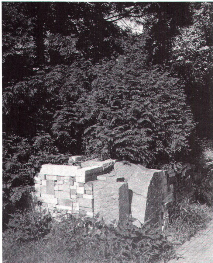
Ein Element aus Abfallmaterial in einem Garten von Le Roy als Kontrast zur wuchernden Natur.

Vielzahl der Gärten, Parkanlagen, Innenhöfe, Plätze und Ecken in einem Stadtgefüge kann das bieten. Kein Einheitsgrün, sondern eigenständige, vielfältige Orte. Aktuelle Gartenarchitektur erachte ich dort als gegeben, wenn mit baulichen und vegetabilen Mitteln atmosphärische Räume im Aussenbereich gebildet werden, die den Ort in die Umgebung einbinden, ohne dass er sich unterordnet. Die Gärten als ein Stück «Wahrheit», die in der Kunst zu finden ist, inkommensurabel bleibt, also nicht vereinnahmt werden kann, und dennoch kommunikativ ist. Authentizität ist gefordert anstelle einer nostalgisch-oberflächlichen Harmonisierung. Die Zukunft liegt in der Bewältigung der Gegenwart. Es gibt keine Rezepte, aber eine Tradition, Vorbilder, Auseinandersetzung und vielfältige Versuche.