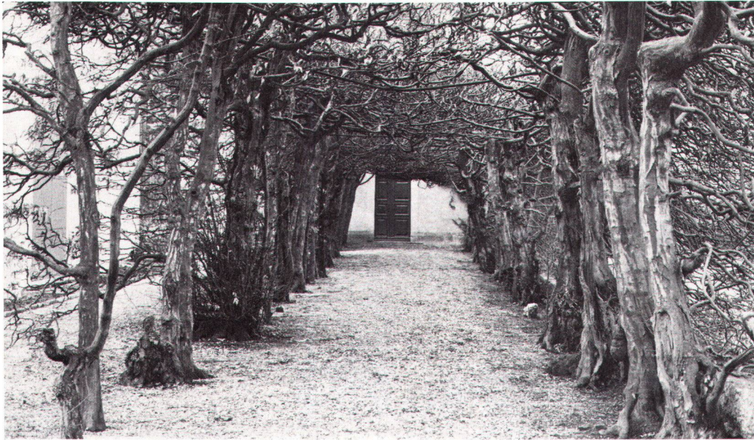
Ein sogenannter Schattengang aus Hagenbuchen führt vom Wohnhaus zur Kapelle beim Landsitz «Weisse Laus» in Solothurn.

Au manoir «Weisse Laus», à Soleure, une allée ombreuse de charmes mène de l'habitation à la chapelle.