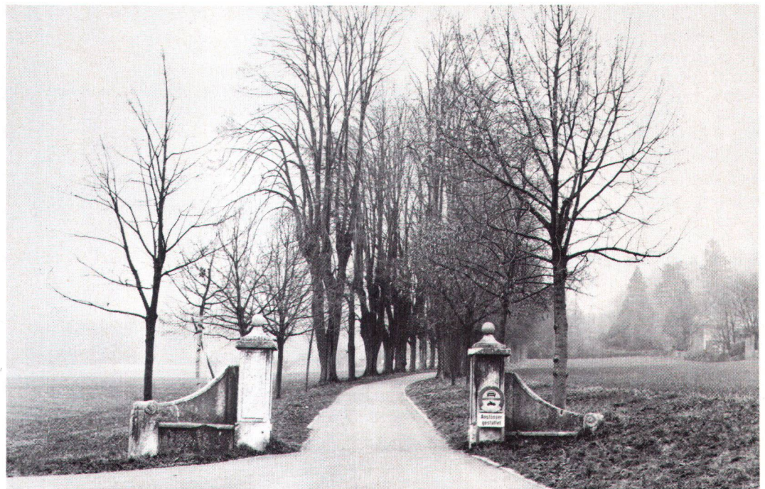
Die barocken Landsitze greifen mit ihren Alleén oft weit und prägend in die Landschaft hinaus – hier der Eingang beim Königshof in Rüttenen.

Beim Bally-Park in Schönenwerd musste vor einiger Zeit die Gärtner-Equipe aus finanziellen Gründen leider empfindlich reduziert werden. Im Zeichen des ökologischen Umdenkens werden heute einige als englischer Rasen gedachte Flächen in der Art von Magerwiesen unterhalten. Ich denke, dass dies vom garten- und denkmalpflegerischen Standpunkt aus dann vertretbar ist, wenn man sich zwischen Eigentümer, Naturschutz und Denkmalpflege abspricht, architektonisch weniger wichtige Teile als Magerwiesen ausscheidet, die Kernstücke aber weiterhin als Rasen pflegt. Schlimmer ist, dass die nach genauem Plan und in bestimmter gestalterischer Absicht gesetzten Baum- und