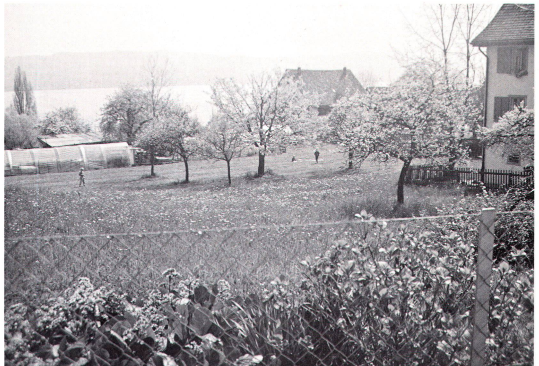
Der Bauernhof Schipfer in Zürich-Wollishofen ist von der Stadt an einen Landwirt verpachtet worden, der hier biologischen Landbau betreibt.

Aufgrund einer Analyse der Konflikte von Nutzungsmöglichkeiten gemäss Entwurf der neuen Bau- und Zonenordnung der Stadt Zürich wurden dem Hochbauamt konkrete Vorschläge zur Umzonung