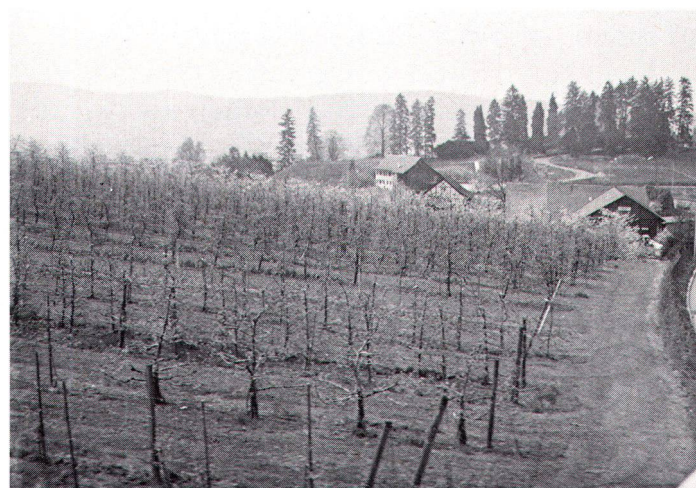
Obstplantage am Riedhoferberg in Zürich-Höngg, an der ein für die Stadtbewohner wichtiger Wanderweg vorbeiführt (Bild Gartenbauamt).

Im Rahmen dieser Arbeit wurde versucht, mit einer allgemeinen Schätzung die Grössenordnung dieser Beiträge abzuschätzen. Gesamthaft kann davon ausgegangen werden, dass im Maximum jährliche Mittel im Ausmass von rund 1 bis 1,5 Mio. Franken für Infrastrukturmassnahmen, für die Neuanlage von Landschaftselementen, für Nach-