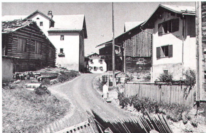
Dans nos villages de montagne, les maisons n'ont pas toutes le confort auquel on peut prétendre aujourd'hui. Aussi la LSP demande-t-elle que la Confédération contribue aux frais supplémentaires qu'exige un entretien conforme à la protection du patrimoine.

L'attitude entreprenante de la Commune est d'autant plus louable qu'elle était et est exposée à une pression considérable due à l'afflux d'habitants, aisément concevable si l'on songe que depuis 1950 la population a doublé et dépasse aujourd'hui les 10000 âmes. Les nombreux hameaux situés en zone agricole restent en dehors des zones à bâtir. Ils y restent aussi dans le «plan de zones 1990», mais en plus, certains d'entre eux sont mis en «zones de sites à protéger». Le premier des deux objectifs se reflète dans le statu quo pour