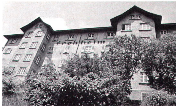
Das «Frohheim» in Grenchen, welches hätte abgerissen werden sollen.