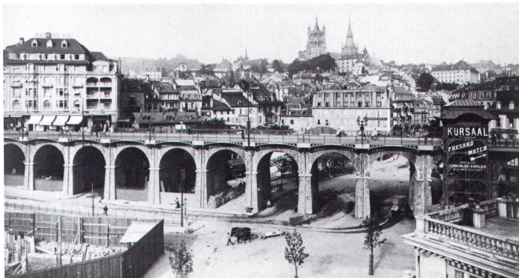
Beim Heimatschutz der ersten Stunde verpönt: «Geraden» jeder Art – hier als Brückenneubau in Lausanne.

Der Respekt vor der Vergangenheit entlehnten Architekturformen verstärkt sich noch durch die Bewertung der Natur und ihrer Sprache, was sich niederschlägt in ästhetischen Regeln, die den Bogen der als künstlich erachteten Geraden, das Holz und den Stein dem Eisen, Beton oder dem Eternit vorziehen. Diese Hierarchisierung der Werte folgt dem Bedürfnis, sich in der (heimatlichen) Scholle und im Dorf, als traditioneller Form des Zusammenlebens und als Ort der Harmonie und Reinheit, zu verankern. Die Verherrlichung des Ländlichen wurzelt vor allem im Willen, die sozialen Konflikte und den Klassenkampf der Industriegesellschaft zu überwinden und durch die Bindung an den Boden ein Nationalgefühl zu entwickeln, bei dem das Schöne als Quelle heimatlicher Liebe eine wesentliche Rolle spielt und zu einem der wichtigsten Anliegen des Heimatschutzes wurde. Dessen besondere Definition des Schönen und Authentischen, welche alles ablehnt, was nicht dem Erbe und der Vergangenheit verpflichtet ist, enthält sich somit als Denksystem, das den Rückzug und den Immobilismus bevorzugt, indem es dem Mythos einen Anstrich von Ewigkeit verleiht.