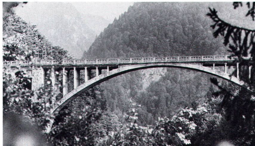
Le pont des Planches, encore en son état originel, avec ses intéressants enrobages de béton armé.

Sur le pont des Planches et les plus anciens barrages de Suisse, dont celui de la Joux-Verte, a été montée une petite exposition d'histoire technique, en français, qui comprend 8 panneaux de 83 × 120 cm et peut être louée à ceux que cela intéresse. Renseignements au 025/26 17 59.