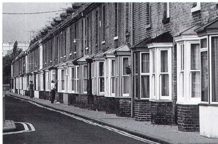
Die Erhaltung dieser Siedlung in Canterbury ist nicht denkbar ohne Bewahrung der inneren Bausubstanz und Besitzstruktur

dem öffentlichen, lauten Ruf nach Verdichtung und dem öffentlichen Auftrag der Denkmalpflege keine Konflikte gibt, oder ist der Ruf nach Verdichtung so übermächtig – politisch und sachlich –, dass Denkmalpflege gar nicht erst ihre Stimme erhebt?