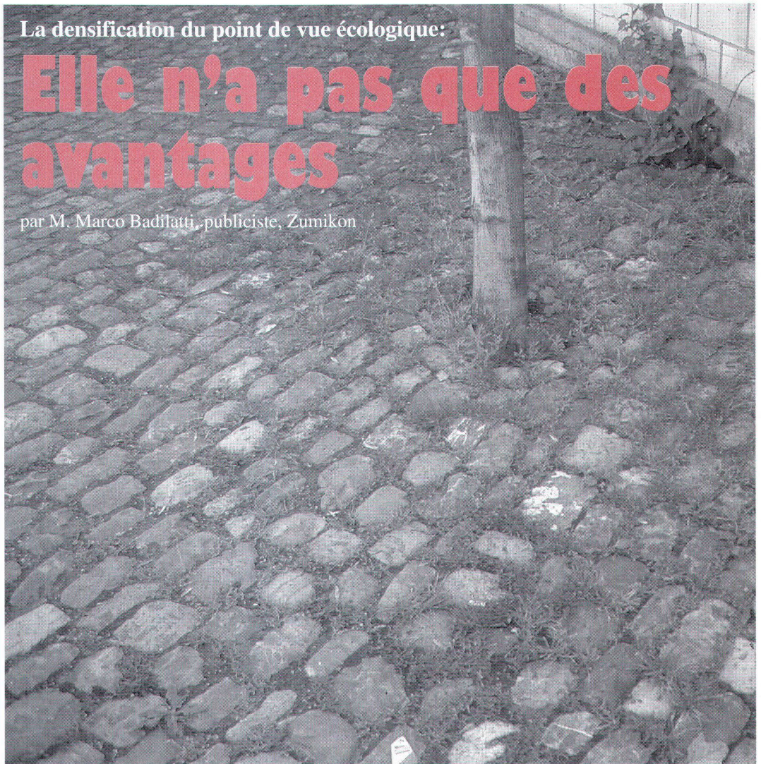
Pavage favorable, avec sa végétation, à l'infiltration des eaux. Sickerfreundliche Pflasterung mit Gras- und Baumwuchs.

par M. Marco Badilatti, publiciste, Zumikon