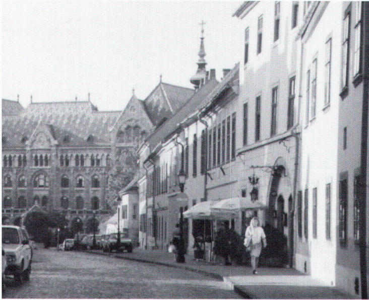
Dans le quartier du château de Buda. Im Schloss-Quartier von Buda.

riété d'influences: églises bénédictines, basiliques, temples calvinistes et luthériens, églises orthodoxes, synagogues et quelques rares mosquées. Outre les châteaux, dont certains témoignent des fastes de l'époque baroque, le patrimoine hongrois s'enrichit de nombreux autres édifices qui rappellent les conditions de la vie quotidienne: maisons rurales, moulins, etc. A Budapest, outre la colline de Buda et le cours majestueux du Danube, des bâtiments et des quartiers caractéristiques du début du siècle retiendront l'attention du visiteur averti. Les courants de l'Art Nouveau et de la Sécession ont laissé des témoins dignes d'intérêt. En province, dans de petites villes telles que Kecskemet, on découvre d'étonnants édifices de cette époque.