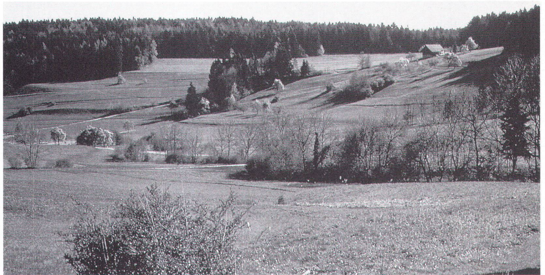
Abstention, EEE ou CE – c'est à nous-mêmes qu'il appartient de choisir la meilleure voie pour sauvegarder une nature riche en espèces.

nes, les changements seront sans doute notables. Si les moyens débloqués pour les paiements directs sont insuffisants, les possibilités de correction seront limitées. On peut s'attendre à des mises en jachère de surfaces considérables, surtout dans l'option CE, qui, en l'absence de mesures appropriées, finiraient par se reboiser – évolution qui, sous l'angle strictement paysager, n'est pas forcément regrettable. Sur le Plateau, et surtout dans l'hypothèse CE, on devrait assister à un renforcement de la tendance actuelle à l'augmentation de la taille des exploitations et, dans le cadre des mesures de rationalisation, à l'exploitation de surfaces plus importantes. Cette évolution entraînerait une pression sur les éléments formant l'armature du paysage, avec comme conséquence une uniformisation à grande échelle et donc une banalisation accrue. Il est malaisé d'apprécier si cette tendance pourra être compensée par l'exploitation extensive de certaines terres. A cela s'ajoute le développement des agglomérations, plus marqué dans les scénarios EEE et CE. Il est clair que là où la nature et le paysage sont déjà fortement sollicités, la pression ne fera que s'accroître.