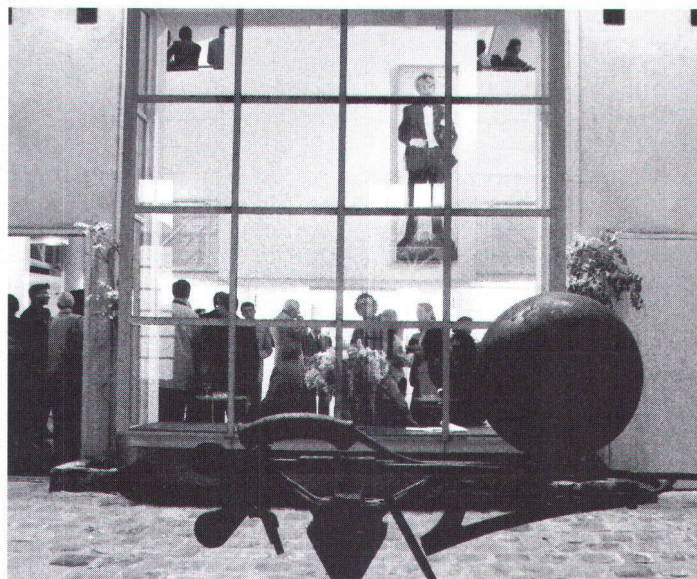
Eine Brücke zum Ausland: das «Centre Culturel Suisse» in Paris.