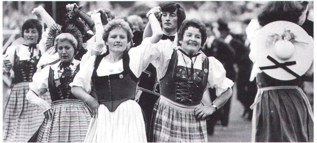
Auf eine starke Internationalisierung folgt im Kulturbereich oft eine Rückbesinnung auf die eigenen Traditionen.

Une forte internationalisation est souvent suivie, dans le domaine culturel, d'un retour aux traditions autochtones.