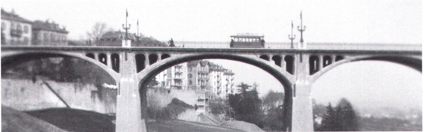
Le pont Chauderon en 1905, avant la création de la plate-forme du Flon. Die Chauderon-Brücke um 1905 vor dem Einbau der Flon-Plattform.

Autour de l'aménagement du Flon à Lausanne