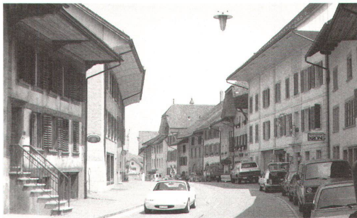
Die neue Umfahrungsstrasse hat zwar die Altstadt entlastet, doch werden jetzt andere Wohngebiete vom Verkehr betroffen.

Die beiden kleineren Gemeinden Wiedlisbach BE und Schöffland AG liegen an mittelmässig belasteten Kantonsstrassen, und bei beiden ist nach der Eröffnung der Umfahrungsstrassen (noch) kein sprunghaftes Verkehrswachstum festzustellen. In Wiedlisbach machte die Entlastung zwei Drittel aus und war damit etwas grösser als in Schöffland. Wegen der geringen Einwohnerzahl dürften die beiden Zentren nicht so schnell mit hausgemachtem Verkehr wieder aufgefüllt werden. Umgekehrt zeigte die Untersuchung der mittelgrossen Gemeinden Lachen SZ und Teufen AR, dass dort der Durchgangsverkehr die vorhandenen Umfahrungen wählt, der innerörtliche und überwiegend hausgemachte Verkehr aber immer noch gross ist, die Umfahrung also nicht alle Probleme zu lösen vermochte. In den noch grösseren Agglomerationsgemeinden bestehen meist Verkehrsengpässe auf der Achse in Richtung Agglomerationszentrum. Werden diese beseitigt, wächst der Verkehr unweigerlich. So konnten zwar im Birstal BL die meisten Gemeinden durch die J 18 entlastet werden, doch zugleich nahm der Verkehrsstrom Richtung Basel sprunghaft zu. Auch in Ostermündigen BE führte die Umfahrung zu einem Verkehrswachstum, ohne dass das