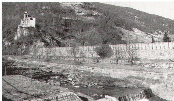
Die aus dem 19. Jahrhundert stammende Wehrmauer mit der Bergkirche San Bernardo im Hintergrund. Les remparts du XIXe siècle, avec l'église de montagne San Bernardo à l'arrière-plan.

Das ursprüngliche Bauwerk aus dem 14. und 15. Jahrhundert, 1427 mit Fresken bemalt, wurde gegen Westen um die Mitte des 15. Jahrhunderts erweitert. Das zusätzliche Segment des Schiffes wurde mit einem Gemälde-Zyklus der Seregneser dekoriert. Die Autoren seien Christoph und Niccolao von Seregno, wohnhaft in Lugano und aktiv zwischen 1455 und 1500. Sie zeigen auf der Südwand verschiedene Szenen aus dem Leben von Heiligen, an der Nordwand eine Darstellung des Abendmahles. Unverwechselbarer stilistischer Zug der Seregneser ist ihre Vorliebe für die dekorative Ausstattung wie auch die archaischen Gebärden und die Drapierung mit noch gotisierendem Geschmack. Der Aktionsradius dieses Ateliers reichte vom Mendrisiotto bis zum Medelser Tal, Disentis und Brigels, von Locarno bis nach Mesolcina. Ihr Werk konzentrierte sich jedoch vornehmlich auf Bellinzona, entwickelte sich im 3. Quartal des 15. Jahrhunderts längs der Transitwege, aber auch an heute ungebräuchlichen Strassen und Siedlungen. Ausser diesen Bildern beinhaltet die Kirche aber auch Fresken des 17. Jahrhunderts (Kreuzigung, die Evangelisten und Szenen aus dem Leben San Bernards). Tritt man aus der Kirche, findet man auf der Aussenwand noch andere Jahrhunderte. Die Vorderseite der Vorhalle, im 16. Jahrhundert hinzugefügt, ist mit Bildern von 1582 geschmückt worden. Die Ikonographie ist interessant, da sie an