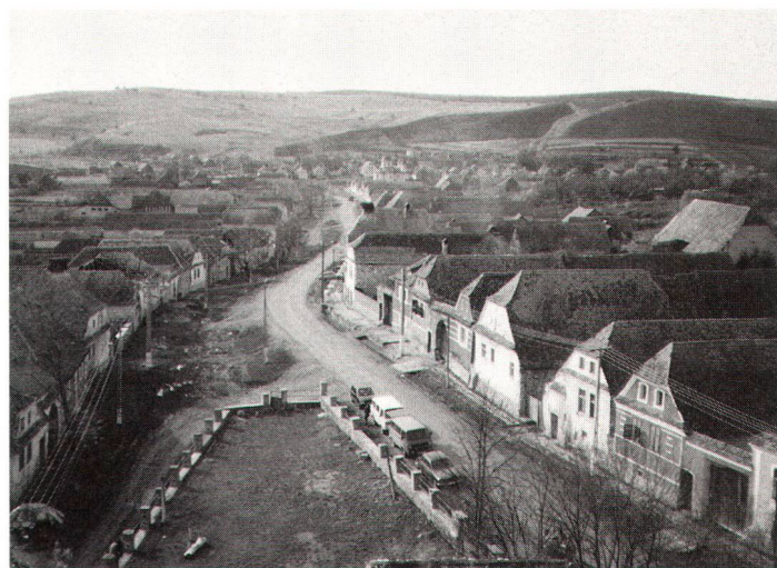
Eines der sächsischen Dörfer im rumänischen Siebenbürgen, das mit deutscher Hilfe inventarisiert wird.

Im Rahmen eines deutsch-rumänischen Kulturabkommens wurde die flächendeckende Bestandsaufnahme des siebenbürgischen Kulturerbes unter Einschluss des gebauten Erbes, der Geschichte, der Kunst und Volkskunst, des Brauchtums, der Sprache und Musik vereinbart. Die deutsche Bundesregierung reagiert mit der Finanzierung dieser Arbeiten