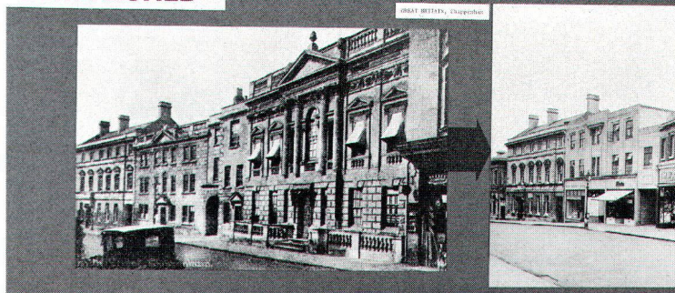
Jährlich gehen der europäischen Kulturlandschaft wichtige Zeugen der Vergangenheit verloren. Europa Nostra setzt sich dagegen zur Wehr.

Chaque année, le paysage culturel européen perd d'importants témoins du passé. Europa Nostra lutte contre cette dégradation.