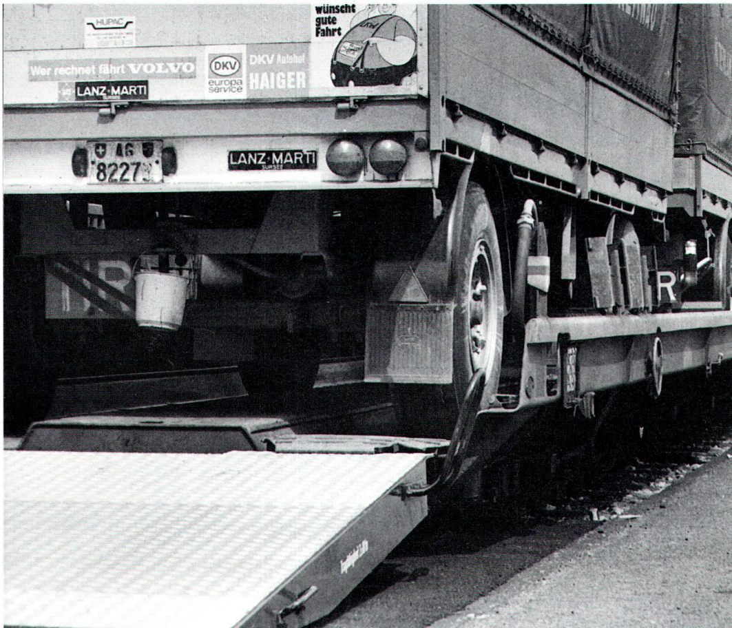
Auf die Schienen mit dem Güter-Transitverkehr! Trafic de transit des marchandises: sur rail!