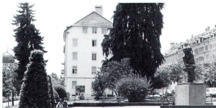
Le S.E.L. tient aussi compte de l'entourage immédiat et des environs d'une habitation.

Cette publication S.E.L. (que l'on peut se procurer à l'Office central fédéral des imprimés et du matériel, 3000 Berne) contient enfin des considérations sur le rapport entre la valeur d'habitation et les prix du terrain et de la construction, ainsi qu'un exemple concret d'évaluation. Ce dernier montre que les «notes» attribuées à chaque élément-critère donnent un aperçu complet des qualités et des défauts d'un projet d'habitation. On constate aussi que le grand nombre de critères utilisés, y compris ceux qui concernent l'intérieur du logement, donne de ce dernier une idée étonnamment concrète. De toute façon, il y a toujours des éléments subjectifs empêchant qu'une évaluation puisse jamais avoir un caractère absolu et indiscutable.