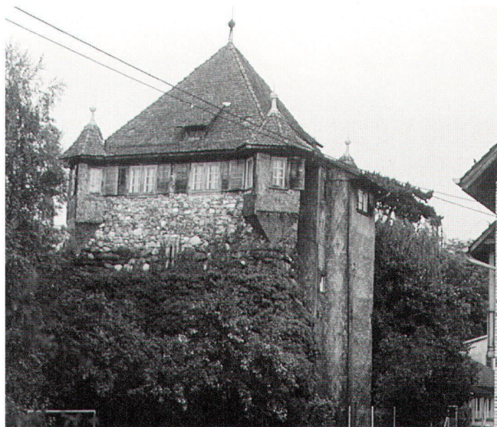
Der Hardturm wird einziger Zeuge der über hundertjährigen Epoche der Schoeller Textilindustrie sein. La «Hardturm» va être l'unique témoin de l'époque plus que centenaire de l'industrie textile Schoeller.