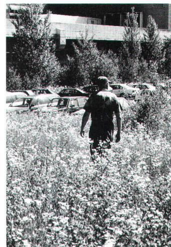
Ruderalflora und einheimische Gehölze umgeben den unversiegelten Parkplatz des Migros-Verteilzentrums in Suhr-Wynenfeld. Flore rudérale et boqueteaux d'origine locale entourent la place de parc (à surface perméable) du centre de distribution Migros de Suhr-Wynenfeld (AG).

«Die geringeren Investitionskosten und die viel tieferen Pflegekosten verlangen geradezu nach naturnahen Lösungen! Die kurz- und langfristigen nicht produktiven finanziellen Mittel sind immer knapp. Wichtig ist, dass der grosse qualitative, ideelle Gewinn am Arbeitsplatz den Menschen immer wieder mit Beiträgen in der Personalzeitung, Schriften, Vorträgen und mit Führungen durch die Anlage bewusst gemacht wird.