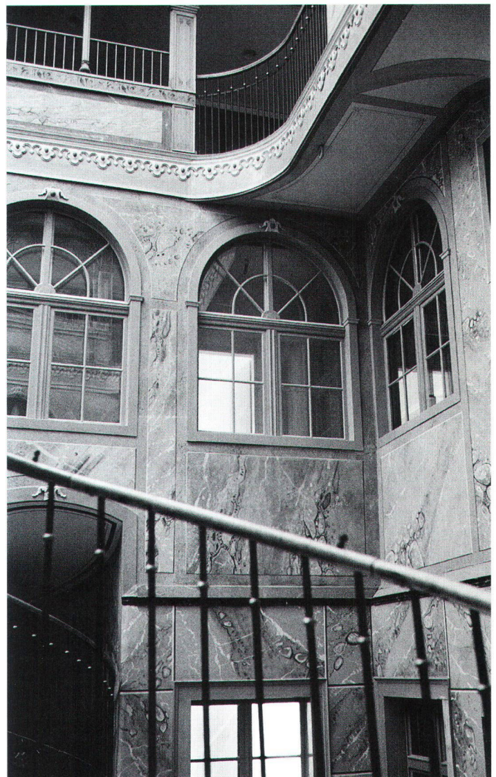
Dans l'élégante cour intérieure ont régulièrement lieu des manifestations culturelles. Im schmucken Innenhof finden regelmässig auch kulturelle Veranstaltungen statt.

Ligue neuchâteloise du patrimoine Le président: Claude Roulet