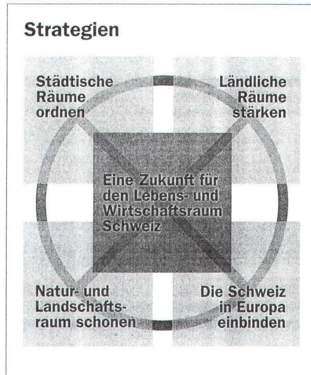
Bundesamt für Raumplanung 1996

verknüpft und für sie Aussenräume geschaffen und gepflegt werden. Auch sind die Agglomerationen in ihrer Ausdehnung zu begrenzen und räumlich besser zu strukturieren, deren Ortszentren aufzuwerten, die Wohnquartiere vor Nutzungsverdrängungen zu schützen und in ein leistungsfähiges System des öffentlichen Verkehrs einzubinden.