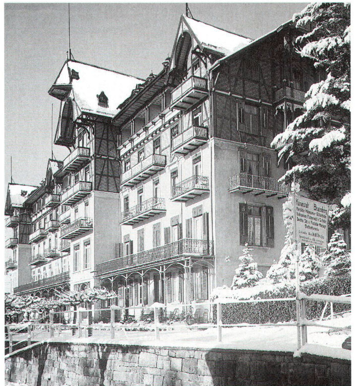
Im Schweizerhaus-Stil erbaut wurde das Hotel «Schweizerhof» in Beatenberg.

L'hôtel «Schweizerhof» du Beatenberg a été construit dans le style suisse.