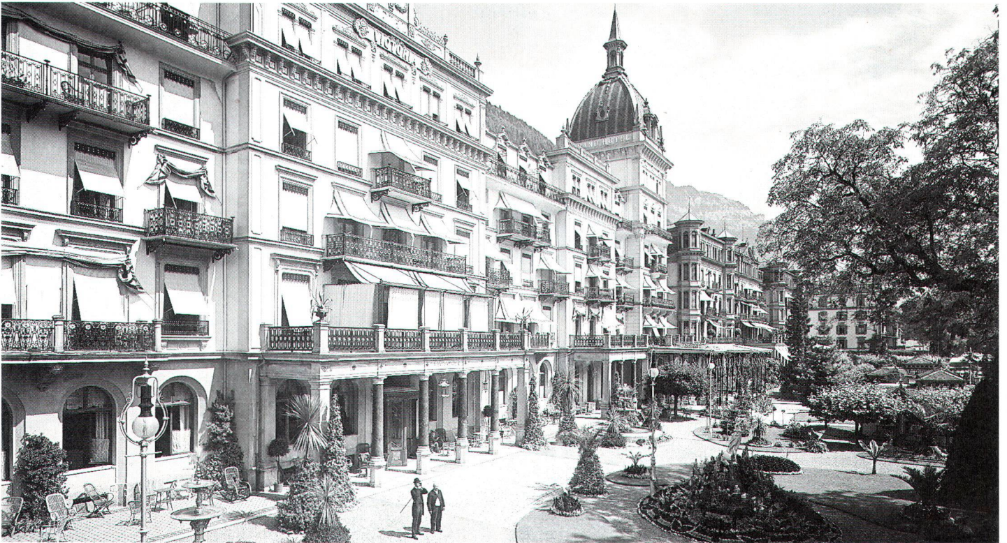
Historische Ansicht des Grand Hotels «Victoria-Jungfrau» in Interlaken. Ancienne vue du Grand Hôtel «Victoria-Jungfrau», à Interlaken.

Die Tourismus- und Hotelbranche wünscht: