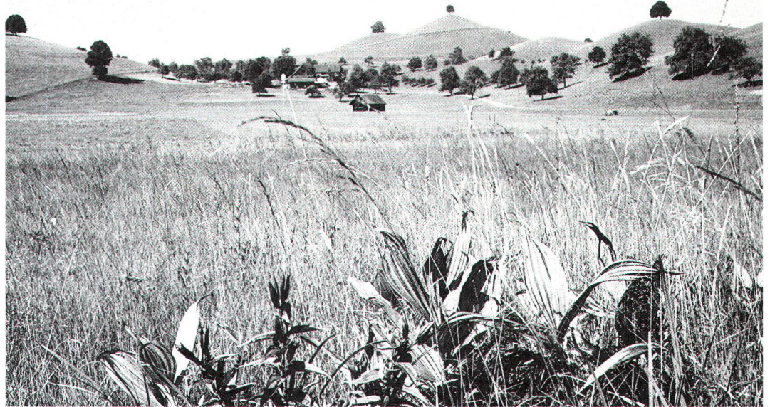
Im neuen Natur- und Heimatschutzgesetz wird den Moorlandschaften besondere Beachtung geschenkt.

Regelmässige, geometrische Anordnungen von Feldern, kanalisierten Gewässern oder Niederstammkulturen empfinden viele Jugendliche als langweilig und öd. Einen hohen Erlebniswert und ein ästhetisch positives Urteil erhalten hingegen abwechslungsreiche, kleinräumige Landschaften, in denen die natürlichen oder naturnahen Elemente dominieren, unregelmässige, nicht schachbrettartige Strukturen vorherrschen und die menschlichen Bauten und Veränderungen sich harmonisch in die Struktur der Landschaft einfügen (z.B. ungeteerte Feldwege oder traditionelle Bauernhäuser). In solchen Landschaften stellen sich bei Jugendlichen auch psychologische Erlebniswerte ein wie romantische Stimmung, Eindruck von Geborgenheit, Wildnis, Lebendigkeit und Frische. Derartige Wunschlandschaften von Jugendlichen sind nun aber in der Schweiz, insbesondere im Mittelland, Mangelware geworden.