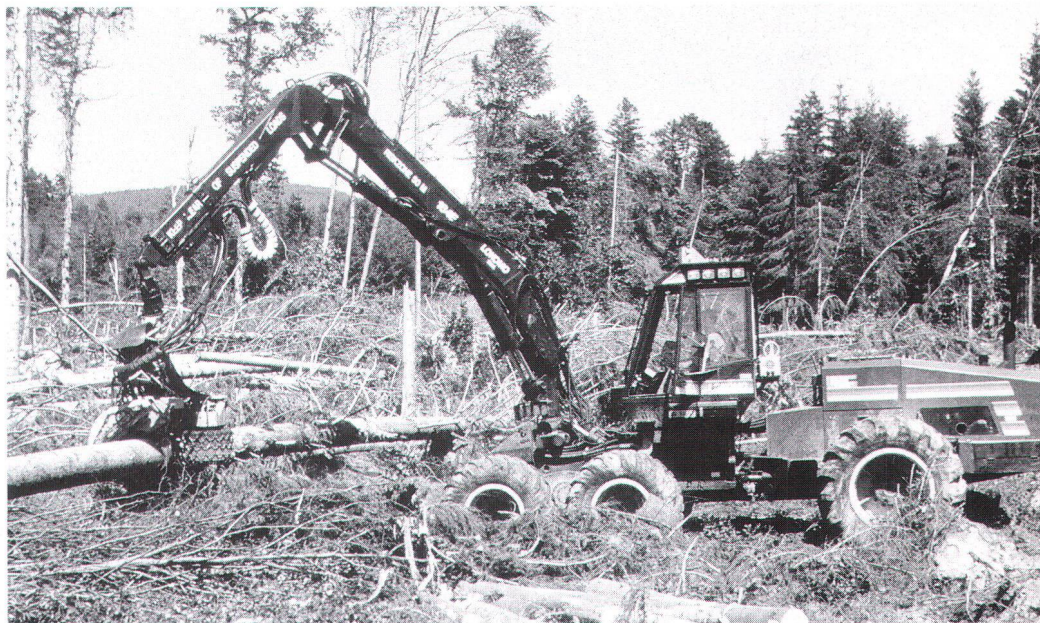
Les simplifications de procédure envisagées dans le cadre des autorisations de défrichage enlèveraient tout pouvoir à l'OFEP. Die geplanten Verfahrensvereinfachungen bei den Rodungsbewilligungen entmachten das Buwal.

simplification des procédures d'autorisation qui visent à englober des procédures jusque là indépendantes, par exemple les autorisations de défricher. De plus, la tendance à attribuer des enveloppes budgétaires pour les subventions fédérales réduit les possibilités de contrôler le respect des exigences fédérales dans la réalisation des projets.