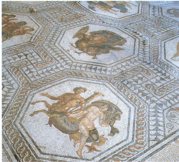
Historische Wegnetze – hier Mosaik des Gutshofes von Boscéaz am Römerweg bei Orbe befriedigen sportliche und kulturelle Bedürfnisse.

Zusammenfassend lässt sich feststellen, dass die Schweiz durchaus ein kulturelles Angebot besitzt, welches die Touristen interessiert. Wie die verschiedenen Untersuchungen aber zeigen, muss dieses Angebot in der Werbung sozusagen in den wichtigsten USP (Unique Selling Proposition) des Schweizer Tourismus, die Landschaft, eingebettet präsentiert werden.