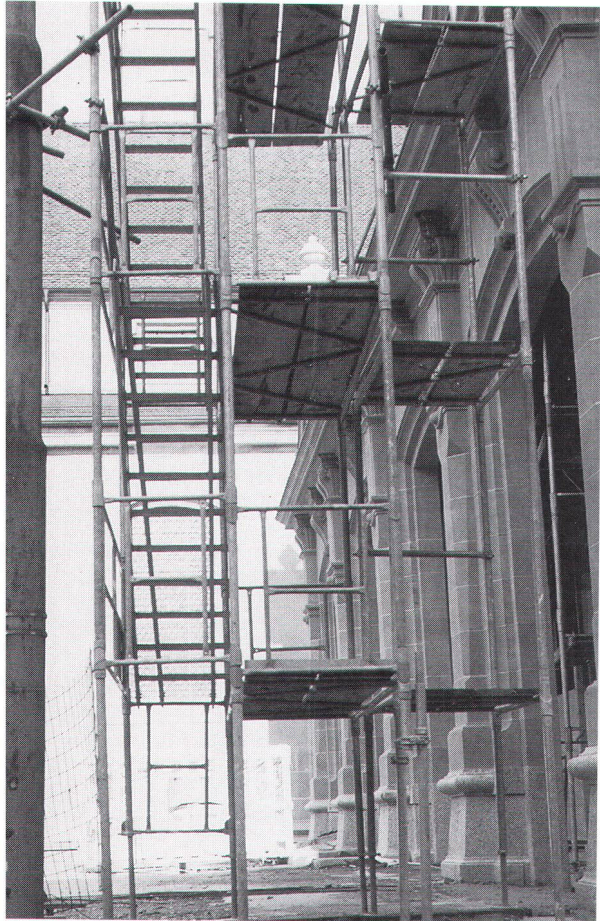
L'ancien dépôt de trams de Fribourg est en pleine transformation; il abritera les œuvres de l'artiste J. Tinguely.

Das ehemalige Freiburger Tramdepot wird zurzeit umgebaut und soll fortan dem künstlerischen Werk Tinguelys gewidmet sein.