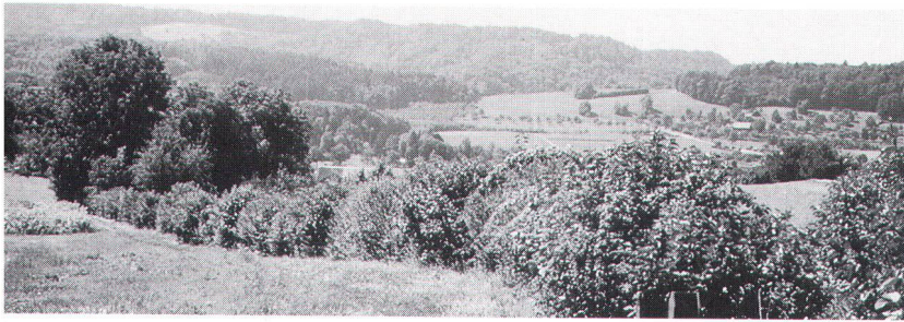
Ökologisch wertvolle Panzersperre in Urdorf ZH.

Des voies d'accès interdites aux chars parce qu'elles présentent une valeur écologique, à Urdorf (ZH).