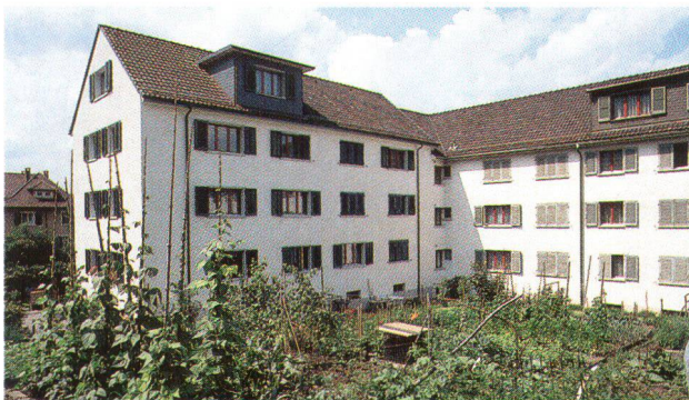
In der Genossenschaftssiedlung Geissenstein sind Wohnmodelle eines ganzen Jahrhunderts vereinigt. La coopérative d'habitation de Geissenstein réunit des modèles typiques de l'évolution du logement au cours de ce siècle.

Gebäude aus der dritten Bauphase aus den sechziger Jahren. Die schnell gebauten Wohnblöcke waren bereits mit akuten Bauschäden behaftet und erforderten eine gründliche Sanierung.