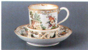
Oben: Trembleuse mit Blumen- und Landschaftsdekor, um 1775; Unten: Soldat mit Pferde als Allegorie Europas, um 1770.

En haut: trembleuse avec décor de fleurs et paysages, 1775 environ; en bas: soldat avec chevaux, allégorie de l'Europe, 1770 environ.