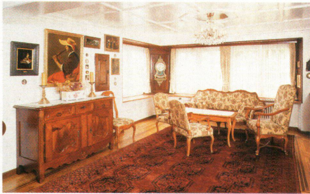
Berner Sitzgruppe im Louis XV-Stil im Musikzimmer. Fauteuils bernois de style Louis XV, dans le salon de la musique.

schaftsbildern, Zeichnungen und Stichen der näheren und weiteren Umgebung sowie antike Möbel vorwiegend regionalen Ursprungs, Uhren, Textilien, Teppiche, Keramik, Leuchter, Zinn usw. vom 16. bis 20. Jahrhundert. Gemäss Stiftungsurkunde soll das Agentenhaus und dessen Ausstattung so erhalten bleiben, wie es der Stifter eingerichtet hat, was es zu einem hervorragenden Beispiel des immer seltener werdenden antiquarischen Wohnstils der zweiten Hälfte des 20. Jahrhunderts macht.