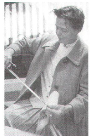
Charlotte Perriand en 1958 et l'aménagement de l'agence Air France à Tokyo Charlotte Perriand im Jahre 1958 bei der Ausstattung der Air-France-Agentur in Tokyo