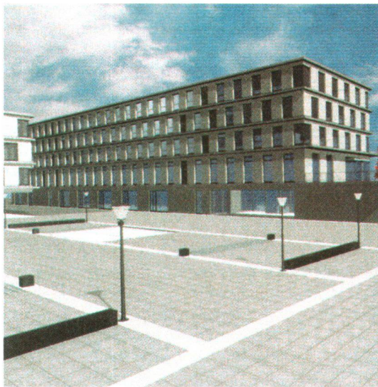
Oben: Mit Cormanon-Est werden Freiburg und Villars-sur-Glâne verzahnt; Rechts: Der künftige Quartierplatz von Cormanon; Unten: Zwischen Autobahn und Siedlungsraum soll in Bertigny-Ouest ein Sportzentrum entstehen. Ci-dessus: Cormanon-Est jouera un rôle d'articulation entre Fribourg et Villars-sur-Glâne. A droite: la future place de quartier de Cormanon; ci-dessous: un centre sportif sera réalisé entre l'autoroute et la zone urbanisée à Bertigny-Ouest.

Mit einem weiteren Projekt in Bertigny-Ouest will man in Villars-sur-Glâne den Raum zwischen Siedlungsgebiet und Autobahn, die hier das Landwirtschaftsgebiet begrenzt, durch drei unterschiedlich genutzte Landschaftsbänder neu gestalten und zugleich das bestehende Verkehrsnetz nutzen. Das erste Band längs der Fahrbahn sieht einen Lärmschutzwall durch Geländeverschiebungen und Baumanpflanzungen vor. Beim zweiten handelt es sich um die Freiräume des hier entstehenden multifunktionalen «Centre Gottéron» mit Sportanlagen (Bäder, Eisbahn usw.), Hotel, Altersresidenz, Geschäftszentrum, Restaurant und Gärten. Inspiriert von französischen Vorbildern ist das dritte Band, der «Parc agricole». Er zieht sich zwischen dem Sportzentrum und den dahinter liegenden Wohnsiedlungen hin, besteht aus Wiesen, Viehweiden und Hecken und soll die Beziehungen zwischen Landwirtschaft und städtischer Bevölkerung fördern. Auf den ersten Blick zwar bestechend, doch fragt sich, ob es sinnvoll ist, Freizeitanlagen auf Kosten der Landschaft an die Stadtränder zu verlegen, die Zentren diesbezüglich aber ausbluten zu lassen und so zusätzlichen Verkehr zwischen diesen und ihrer Peripherie anzukurbeln. Sportzentren und Pärke mitten in der Stadt erscheinen da überzeugender, und zwar in mehrfacher Hinsicht.