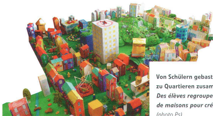
Von Schülern gebastelte Häuser werden zu Quartieren zusammengefügt Des élèves regroupent leurs maquettes de maisons pour créer des quartiers

ps. Patrimoine suisse décerne son prix 2004 au bureau d'architectes Tribu'architecture, à Lausanne, qui propose des animations ludiques et pédagogiques dans cette même ville. En organisant des cours d'introduction à l'architecture pour les enfants, les jeunes et les adultes, l'équipe du bureau d'architecture a mis en place une initiative qui sort de l'ordinaire. La remise du prix aura lieu fin octobre à Lausanne.