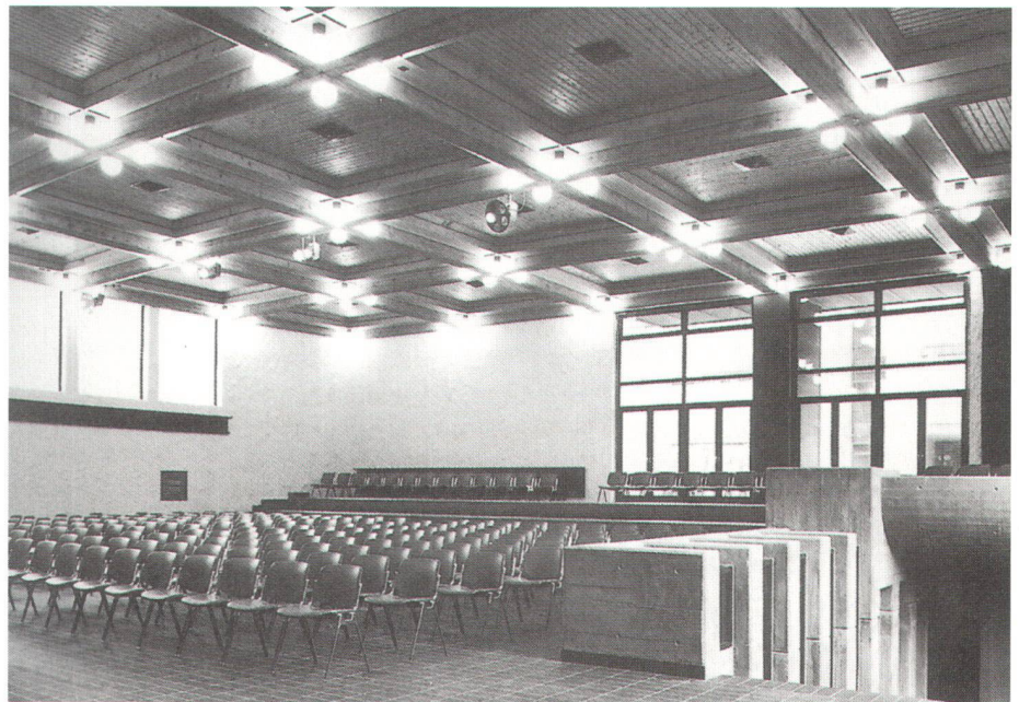
Zusammen mit andern Fachkreisen hat sich der Bündner Heimatschutz erfolgreich gegen den Abbruch der Kantonsschule Chur (hier deren Aula) gewehrt und dem geplanten Neubau gravierende Mängel nachgewiesen.

Ensemble avec d'autres organisations spécialisées, la section grisonne de Patrimoine suisse s'est opposée à la démolition de l'école cantonale de Coire (sur la photo son aula) et a montré les graves lacunes du projet de reconstruction