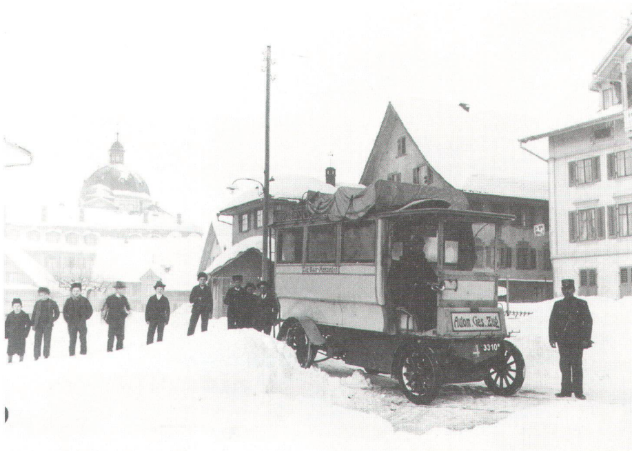
Der Orion-Autobus im Winter 1907 in Menzingen

L'autobus Orion durant l'hiver 1907 à Menzingen