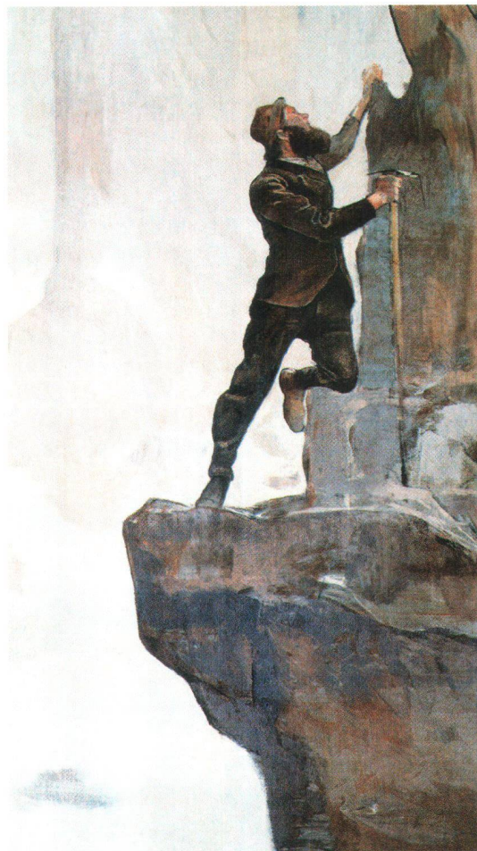
Die Reise - Stunde der Wahrheit. Aus Ferdinand Hodlers Diorama «Aufstieg und Absturz» für die Weltausstellung von 1894 in Antwerpen, heute im Alpenmuseum Bern

In den alten Mechanismus von Exotik und Selbsterfahrung hat sich unterdessen die Wellness-Branche eingeklinkt. Sie macht die unangenehme Kluft, welche die Entfremdung von Körper und Seele hinterlässt, zubarer Münze, indem sie dem Kunden eine Design-Wirklich-