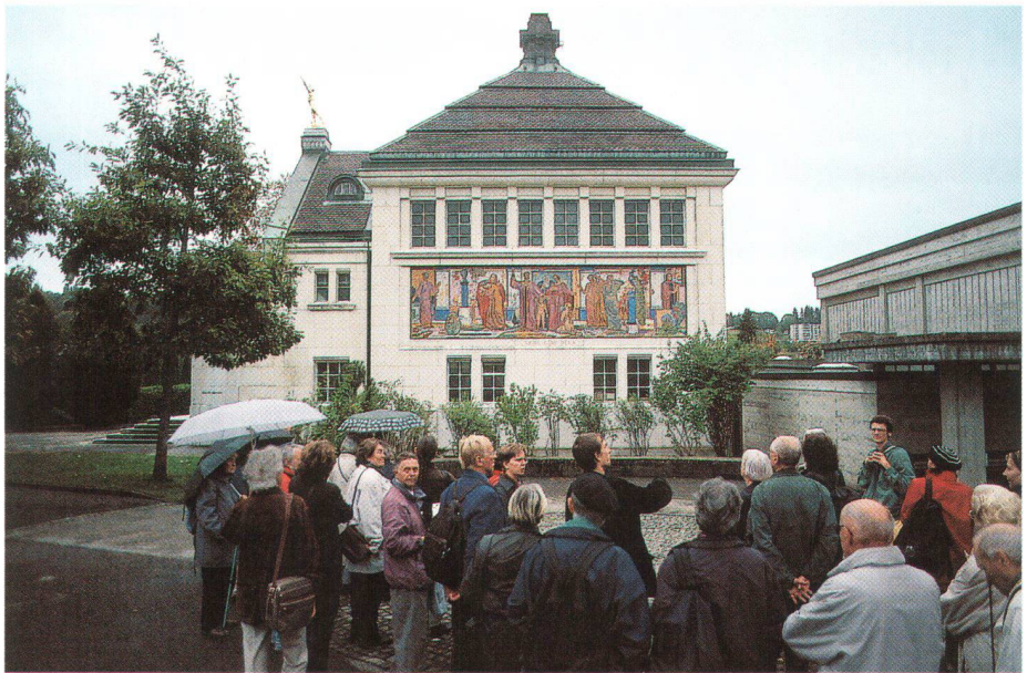
Auf Exkursionen, wie dieser in La Chaux-de-Fonds, lässt sich Baukultur spannend und anschaulich vermitteln