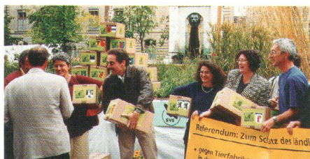
Der SHS unterstützt 1998 das Referendum zum Schutz des ländlichen Raumes