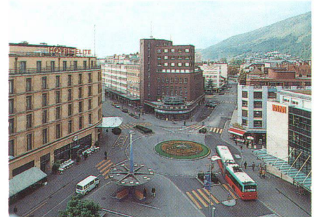
Mit dem Wakkerpreis werden vorbildliche Leistungen von Gemeinden gewürdigt (oben Muttenz und Monte Carasso, unten Vrin und Biel