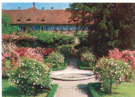
Schulthess-Gartenpreis 2003 für Rosengärten (Ittingen,)