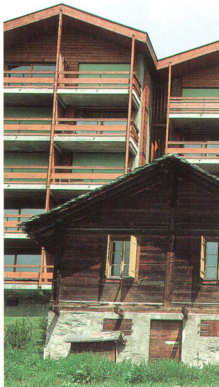
Le bétonnage menace notre patrimoine bâti et dessert le tourisme

Ce travail titanesque dans le domaine de la communication, conjugué à l'amélioration de l'attractivité des publications, commence à porter ses fruits. La diminution des effectifs a pu être stoppée après de nombreuses années d'inquiétude et on observe une augmentation globale de l'effectif des membres. Notre présence dans les médias, le site Internet, des publications attractives et originales et notre bulletin trimestriel, avec sa nouvelle présentation, touchent manifestement un public plus large et incitent à adhérer à notre association. Il reste toutefois indispensable de mobiliser dans les diverses sections des personnes dynamiques, venant de tous les horizons.