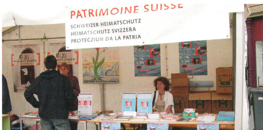
Une association qui n'est pas présente auprès du public tombe rapidement dans l'oubli: stand d'information de Patrimoine suisse