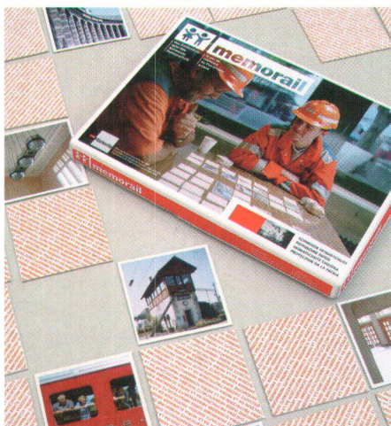
Par ses publications, Patrimoine suisse s'efforce d'intéresser le public au patrimoine architectural (en haut: jeu « mémorail », en bas: bains de Heiden présentés dans « Les plus beaux bains de la Suisse »)

Les discussions actuelles sur le droit de recours des associations illustrent parfaitement l'action menée par Patrimoine suisse. Alors que la polémique actuelle met en avant, auprès du grand public, la suppression de ce droit, la Commission des affaires juridiques du Conseil des Etats s'efforce de modifier le droit de recours pour que celui-ci conserve sa fonction utile. Avec d'autres organisations de protection de l'environnement, Ps cultive ses contacts avec les parlementaires. La complexité des situations et la forte densité réglementaire obligent ces der-