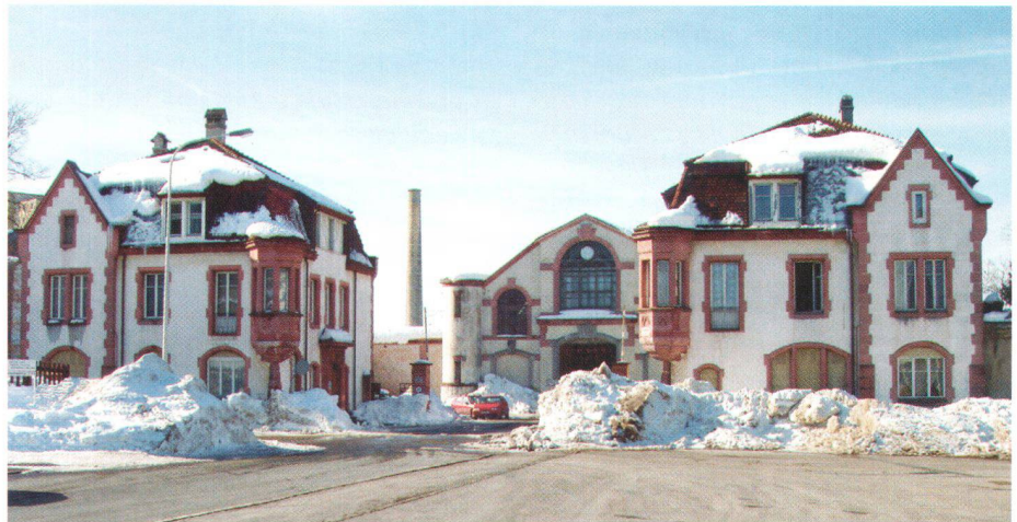
La liste rouge permet d'attirer l'attention sur des bâtiments en péril et met en relation l'offre et la demande: l'abattoir de La Chaux-de-Fonds datant de 1906

Philipp Maurer, Secrétaire général de Patrimoine suisse, Zurich