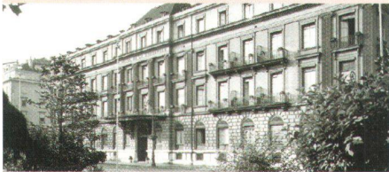
Sauvé en 1977: le «Métropole»

Durant la seconde moitié des années 1970, Patrimoine suisse procède à un examen fondamental de sa situation. Les raisons en sont des questions de teneur, mais aussi, dans une mesure croissante, la difficulté des tâches de coordination incombant au secrétariat, la politique de subventions passée de Patrimoine suisse et par les nouveaux défis inhérents à la politique de l'aménagement, de la protection de l'environnement, de l'énergie, des transports et du tourisme. Le débat porte également sur la question de savoir dans quelle mesure Patrimoine suisse peut se permettre de sympathiser avec certains groupes politiques. Le Bureau et le Secrétaire général sont réélus en 1976. La présidence va pour la première fois à une femme, Rose-Claire Schüle. En 1978, lors d'un séminaire, Patrimoine suisse formule les Thèses de Genève, censées lui donner une nouvelle orientation.