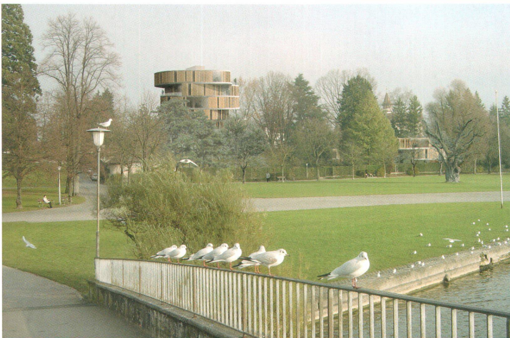
Fotomontage der geplanten Häuser am Graben und zur Promenade auf dem westlichen Teil des Schlossparks, gemäss Projektstand 2005

private Vorhaben politisch möglichst breit abzustützen, wurde die zweijährige Entwicklungsphase von einer grossen Gruppe mit Vertretern des Chamer Gemeinderats, der gemeindlichen Bauabteilung, der gemeindlichen Kommissionen, der kantonalen Denkmalpflege, der kantonalen Raumplanung und der kantonalen Natur- und Landschaftskommission begleitet. Entsprechend haben sie zum Projekt und Bebauungsplan Schloss und Park St. Andreas euphorisch Stellung genommen. Ob bei dieser seit Beginn der Projekt-Entwicklung intensiven Einbindung von Behördenvertretern dann deren für die Amtsgeschäfte verlangte Unabhängigkeit und Objektivität noch gewährleistet sind, wurde bereits beim Blick auf das Architekturmodell mit dem zugestandenen gewaltigen Neubauvolumen bezweifelt. Im überarbeiteten Bebauungsplan 2006 sind die gleich gebliebenen Bruttogeschossflächen von rund 10000 Quadratmetern von den einst drei auf marktkonforme vier Bauten verteilt. Im