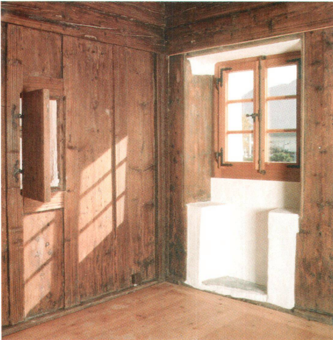
L'ambiance chaleureuse de la maison Rossier est accentuée par des matériaux tels que le bois, la pierre naturelle et la chaux