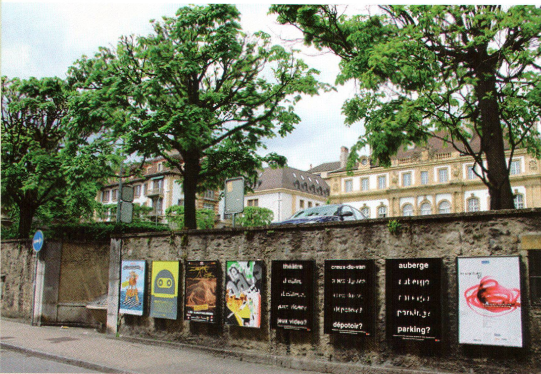
Illustration: Nick Short Ecole d'art de La Chaux-de-Fonds