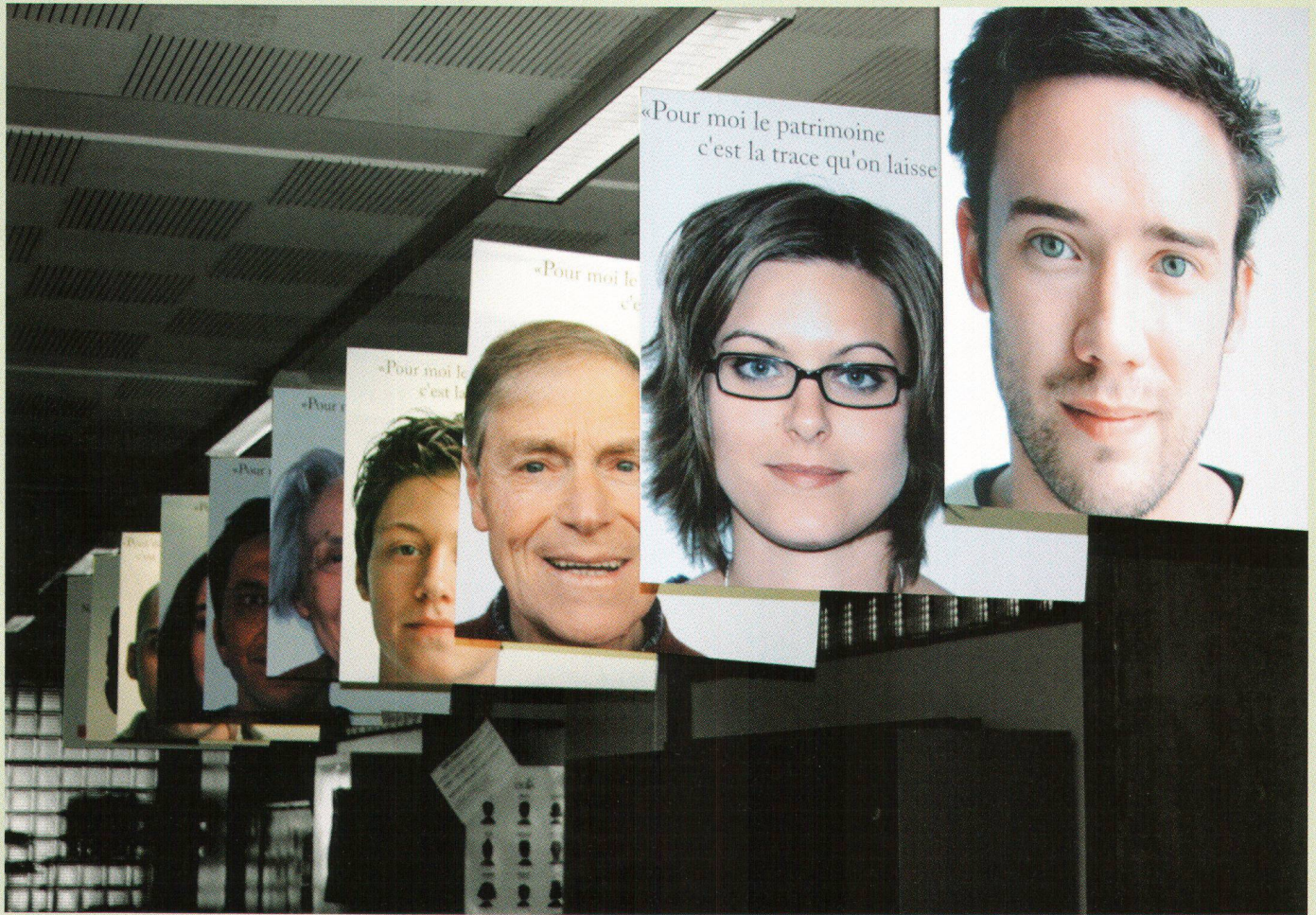
Illustration: Cindy Heimo Ecole d'art de La Chaux-de-Fonds