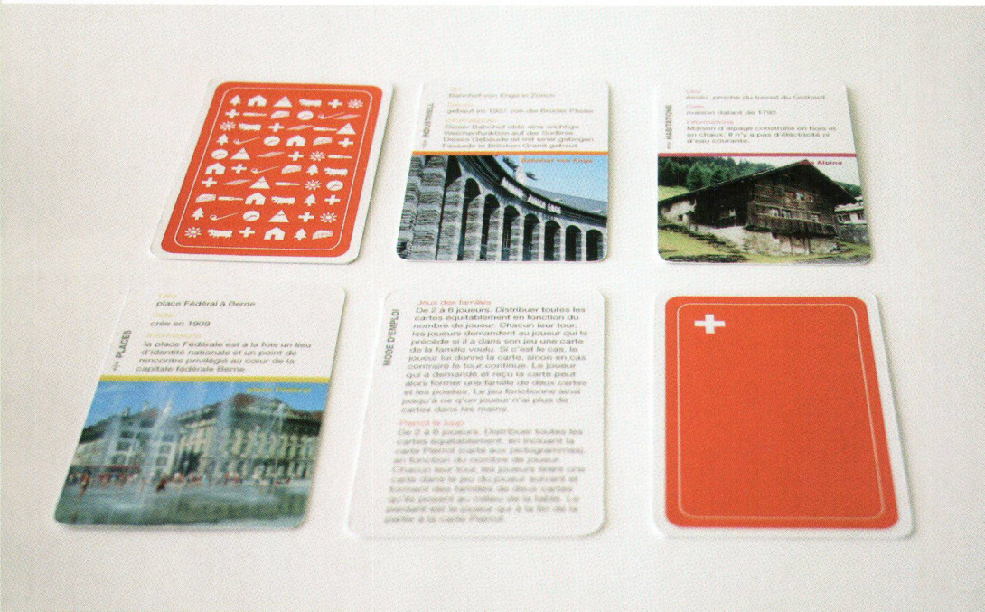
Illustration: Julien Doutaz Ecole d'art de La Chaux-de-Fonds