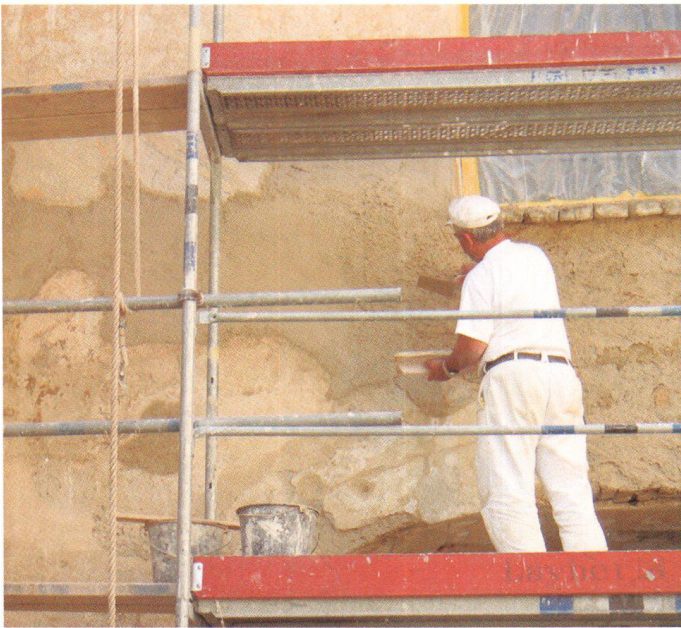
Schliessen beschädigter Fasadenteile mit Kalkverputz im Rahmen eines Grundkurses der Restaurierungswerkstätten in der Kartause Mauerbach/Österreich

Restauration d'une façade endommagée avec du crépi à la chaux dans le cadre d'un cours des ateliers de restauration de la chartreuse de Mauerbach, Autriche