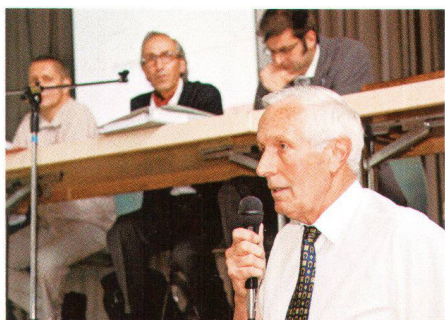
Eindrücke von der DV 2006 in Delémont Impressions de l'Assemblée des délégués 2006 à Delémont