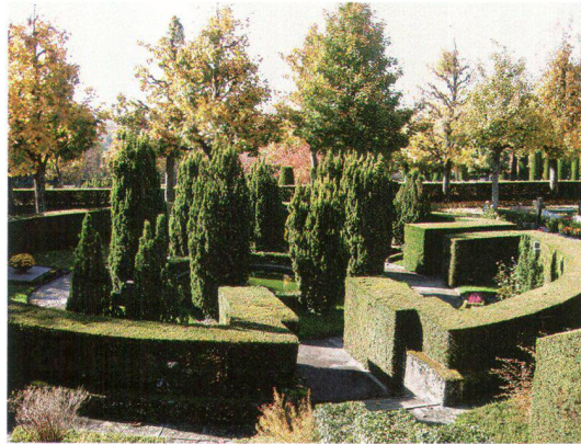
Le cimetière du Bois-de-Vaux allie des éléments de l'architecture paysagère d'inspiration française et italienne

Le cimetière du Bois-de-Vaux est un très beau jardin inscrit à l'inventaire cantonal des monuments et des sites. Considéré dans son ensemble, il nécessite des soins attentifs du Service municipal des Parcs et Promenades. Le développement de la crémation a ralenti le rythme d'utilisation des terrains. Certaines parties du cimetière sont désaffectées et la ville a entrepris des travaux de rénovation visant à réaménager ces secteurs. Le service des parcs et promenades a arraché certaines haies