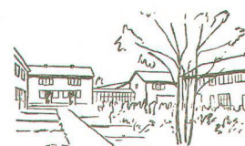
Abb. 15. Der bauliche Ausdruck einer guten Nachbarschaft ist die Wohngruppe, und wie die Kinder um den Tisch, gruppieren sich die Bauten um einen gemeinsamen Platz.