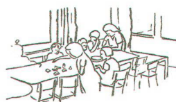
Abb. 14. Der Familientisch ist kein höherer Begriff, sondern eine Wirklichkeit, welche auf die Kinder gemeinschaftsbildend einwirkt.

Für die Zeitgenossen wohl wichtigster Punkt, auf den die an Bedeutung wachsende Landesplanung hinwies, war die simple Erkenntnis, dass der Raum als Ressource begrenzt war und somit haushälterisch mit ihm umzugehen war. So flächenintensiv, wie noch die Kriegssiedlungen geplant worden waren, durfte man nicht