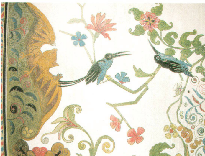
Der Erbauer der Villa Patumbah, Karl-Fürchtgott Zundel-Grob, liess sein Heim im Inneren mit indonesischen Motiven aufwendig ausschmücken. Die Wandmalereien und Schnitzereien erinnern an seine Zeit als Tabakplantagenbesitzer in Sumatra.