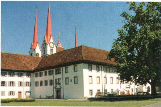
Kloster Muri Couvent de Muri