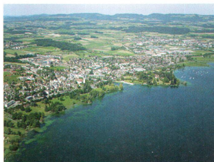
Luftbild von Cham

cka. Chamerinnen und Chamer haben den viel diskutierten Bebauungsplan für die Halbinsel St. Andreas am 9. Dezember 2007 mit überwältigendem Mehr abgelehnt. Bei einer Stimmbeteiligung von annähernd 54 Prozent waren 3030 Stimmberechtigte gegen die geplante Überbauung des Schlossparks, nur 1849 stimmten dem Vorhaben zu. Der Chamer Souverän hat sich klar gegen die notabene vom Chamer Gemeinderat, von den bürgerlichen Parteien sowie vom Gewerbeverein vorbehaltlos unterstützte und von der kantonalen Baudirektion empfohlene Vorlage ausgesprochen und damit für ein anderes, nachhaltiges Vorgehen zum Erhalt von Schloss und Park St. Andreas entschieden. In den kommenden Monaten wird der Zuger Heimatschutz zusammen mit Vertretern des Vereins «St. Andreas ist mehr wert» und des Bauforums Zug erste mögliche Denkmodelle für die Zukunft von St. Andreas in einer Landschaft und einem Ortsbild von nationaler Bedeutung erarbeiten. Dabei sind wir uns bewusst, dass die grosse und nicht unter Denkmalschutz stehende Anlage nach wie vor in Privatbesitz ist und dass Kanton und Standortgemeinde sich künftig mit einem Engagement für die Halbinsel St. Andreas auseinandersetzen werden.